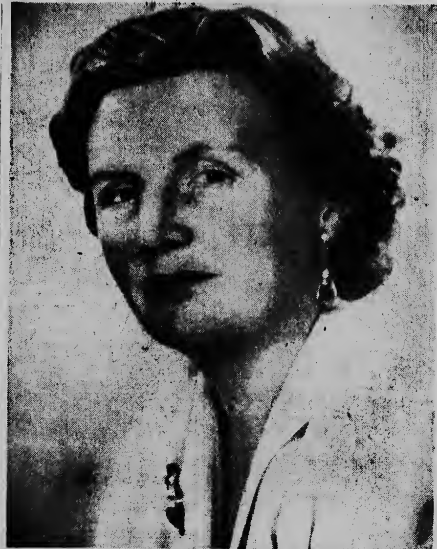
Morgen, 30 April, zat onze Lanoustrouwe, H.M. Koningin Juliana, haar 45ste verjaardag vieren.

9.00 Dankdienst in de R.K. kerk te Oranjestad. Na de Hoogmis zal een Te Deum volgen. 9.00 Dankdienst in de Prot. kerk Te Oranjestad. 14.00 Picknick in de N.W.I.W.A. Club Te San Nicolas. 15.00 Finale Voetbal Junioren in het Stadion. (2x30 min.) 16.00 Finale Voetbal Hoofdklasse in het Stadion (2x45 min.)